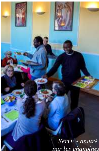
Service assuré par les chanoines