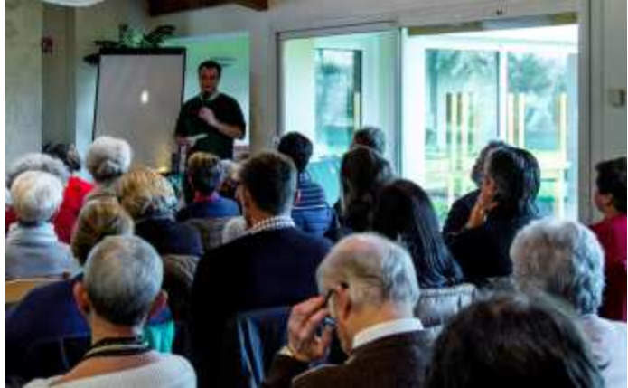
Ambiance d'écoute attentive...